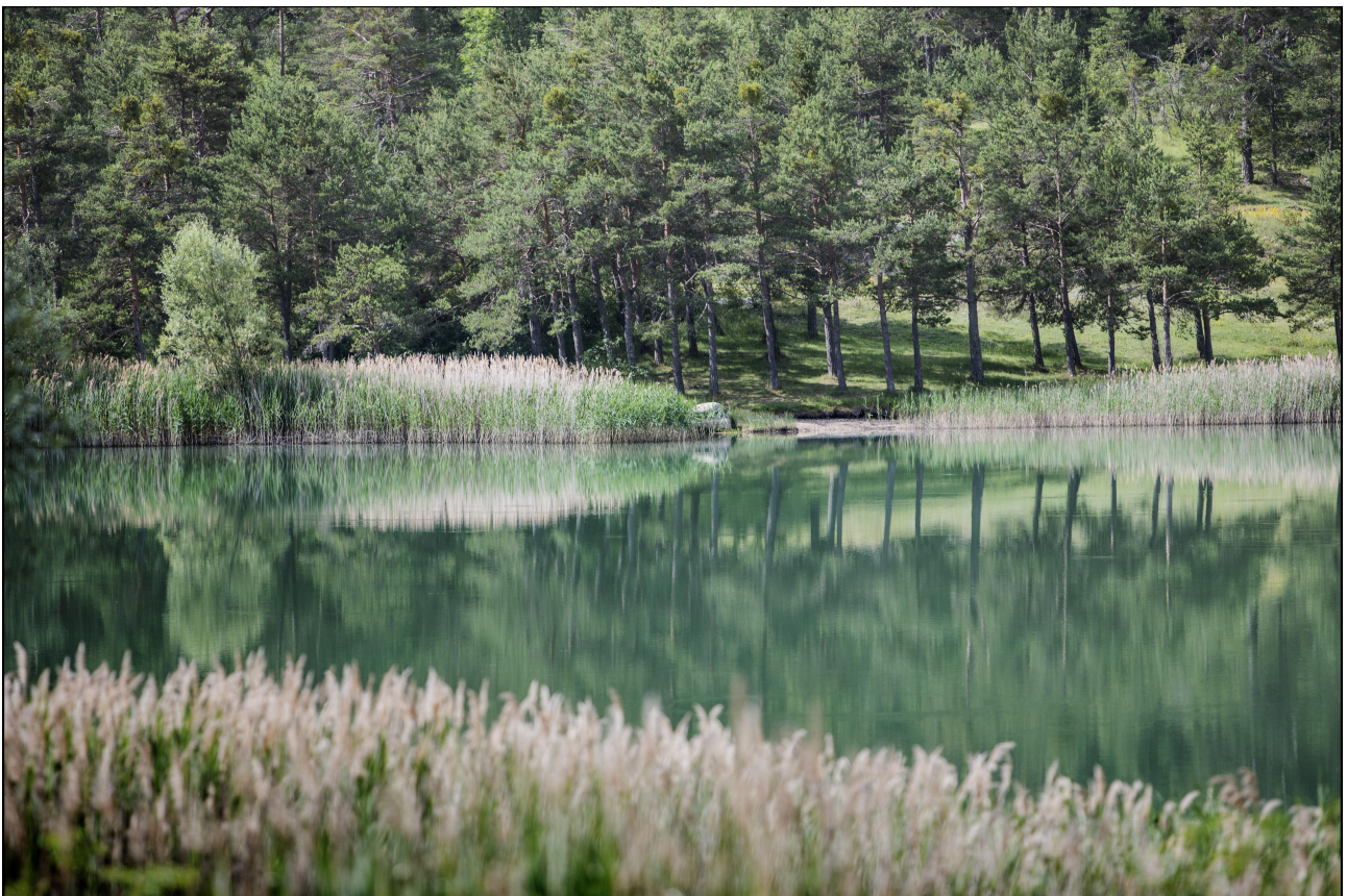
Une pause agréable farniente au bord du Lac des Sagnes à 3 km du village pastoral de Thorame- Haute.